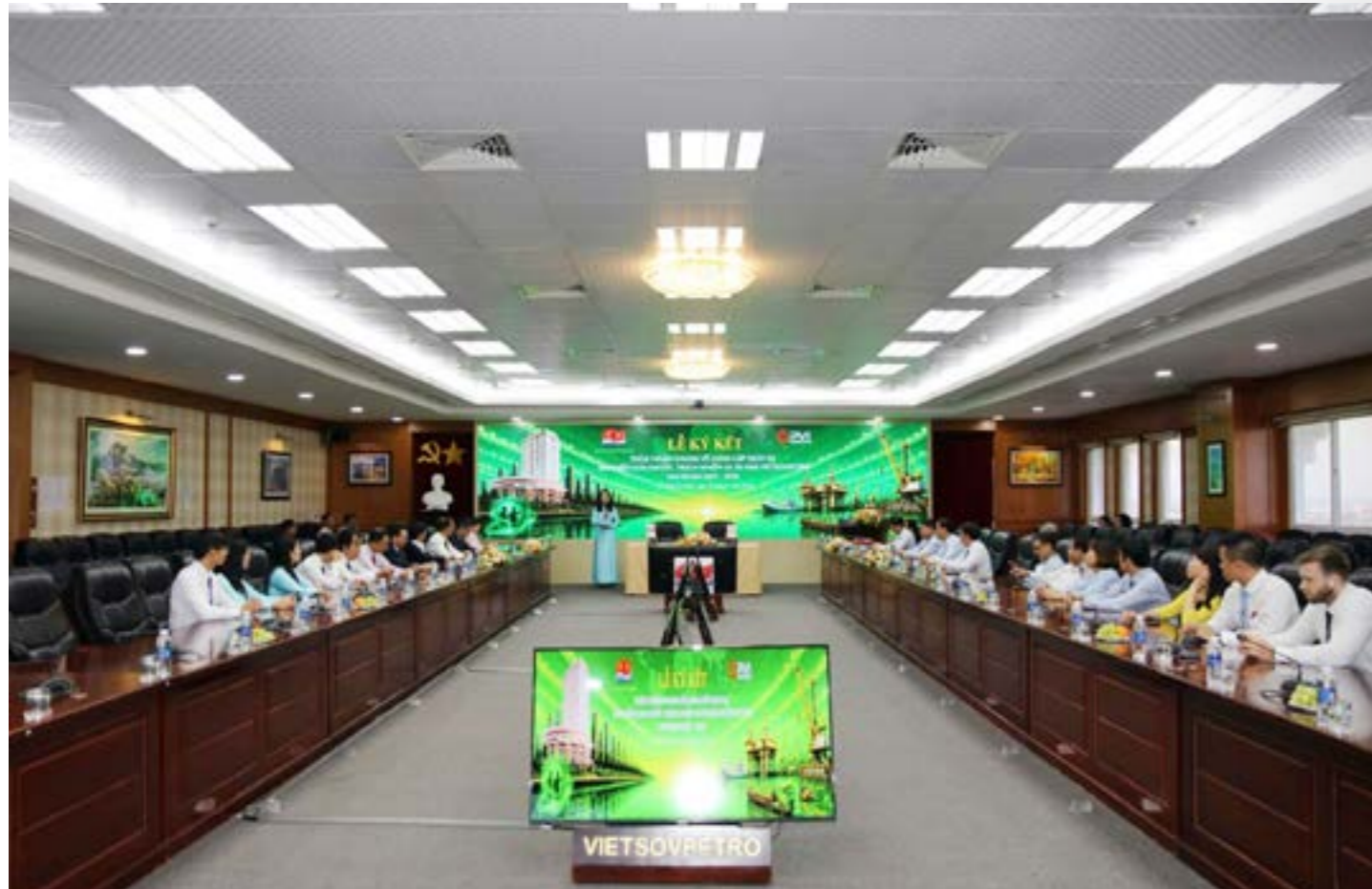
Toàn cảnh buổi lễ ký kết

Ngày 18/05/2026 tại TP.Hồ Chí Minh, Tổng Công ty Bảo hiểm PVI (Bảo hiểm PVI) và Liên doanh Việt – Nga Vietsovpetro đã chính thức ký kết Thỏa thuận khung về cung cấp dịch vụ “Bảo hiểm con người, trách nhiệm và tài sản của Vietsovpetro” giai đoạn 2027–2028. Sự kiện không chỉ đánh dấu bước phát triển mới trong quan hệ hợp tác chiến lược giữa hai đơn vị, mà còn tiếp tục khẳng định năng lực, uy tín và vị thế dẫn đầu của Bảo hiểm PVI trong lĩnh vực bảo hiểm năng lượng – công nghiệp tại Việt Nam.