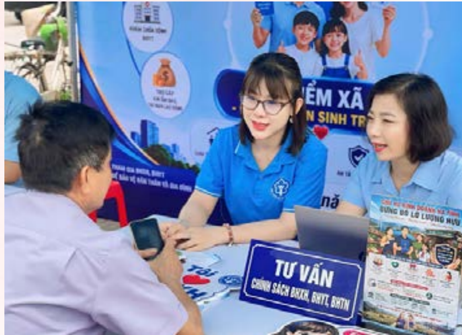
Cán bộ BHXH tuyên truyền, tư vấn chính sách BHXH tự nguyện đến người dân

BHXH tự nguyện ngày càng khẳng định vai trò là chính sách an sinh quan trọng đối với người lao động khu vực phi chính thức. Những năm gần đây, chính sách liên tục được hoàn thiện theo hướng mở rộng quyền lợi, tăng mức hỗ trợ và đẩy mạnh chuyển đổi số, tạo điều kiện thuận lợi hơn để người dân tham gia, thụ hưởng chính sách.