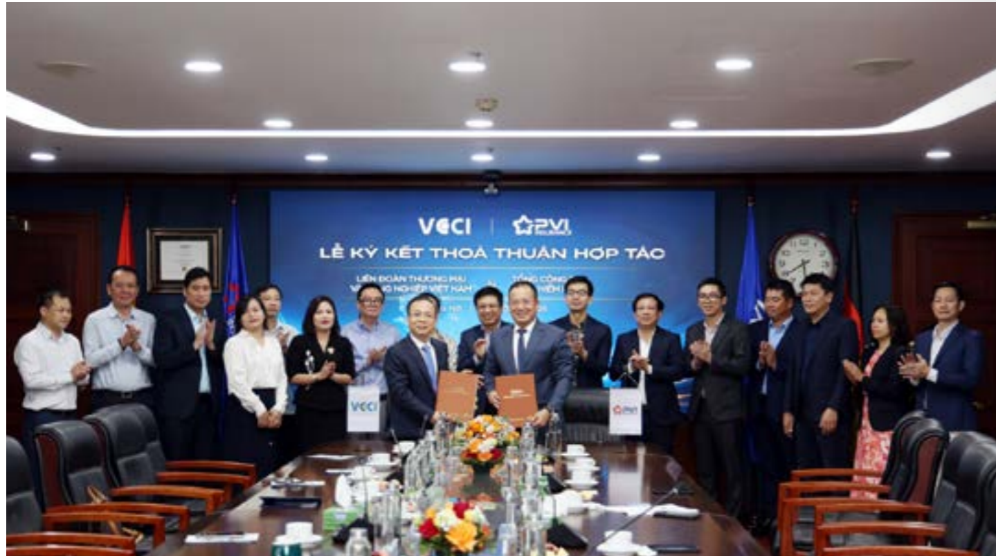
Liên đoàn Thương mại và Công nghiệp Việt Nam (VCCI) và Tổng công ty Bảo hiểm PVI (Bảo hiểm PVI) ký kết Thỏa thuận hợp tác nhằm thiết lập khuôn khổ hợp tác toàn diện trong giai đoạn 2026 – 2027

Liên đoàn Thương mại và Công nghiệp Việt Nam (VCCI) và Tổng công ty Bảo hiểm PVI (Bảo hiểm PVI) đã ký kết Thỏa thuận hợp tác nhằm thiết lập khuôn khổ hợp tác toàn diện trong giai đoạn 2026 – 2027, hướng tới mục tiêu đồng hành cùng doanh nghiệp Việt Nam nâng cao năng lực cạnh tranh, phát triển bền vững và hội nhập sâu rộng vào nền kinh tế toàn cầu.