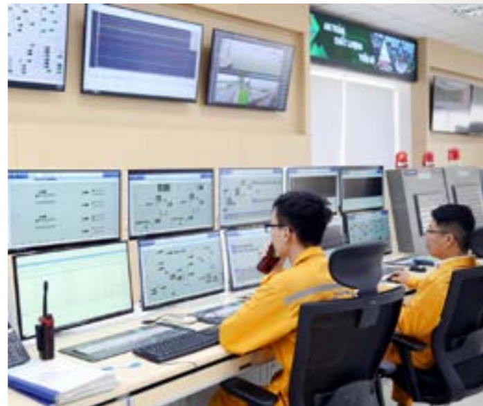
Petrovietnam đang chuyển sang mô hình tăng trưởng theo chiều sâu, dựa trên tri thức, công nghệ và đổi mới sáng tạo

Ngay từ những ngày đầu hình thành ngành, Việt Nam đã cử cán bộ sang Liên Xô, Pháp, Romania, Hungary... để tiếp cận công nghệ dầu khí hiện đại. Quá trình tích lũy ấy giúp Petrovietnam từng bước làm chủ kỹ thuật thăm dò khai thác, xây dựng các công trình lọc hóa dầu, điện khí, dịch vụ kỹ thuật cao và hình thành đội ngũ kỹ sư dầu khí chất lượng cao.