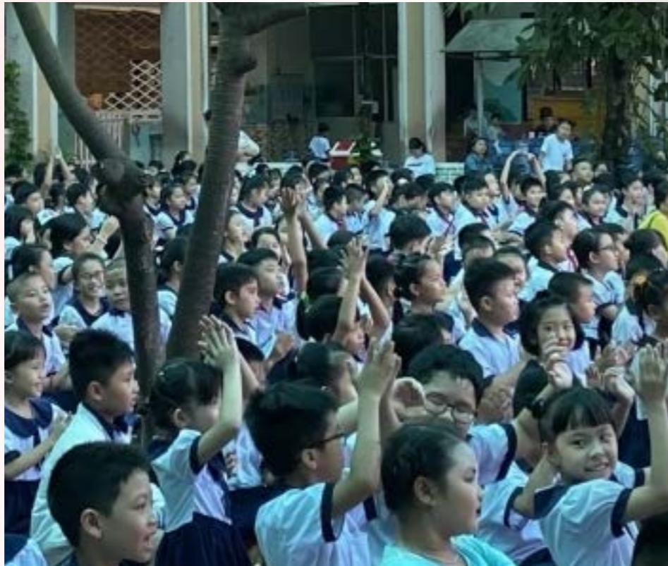
Học sinh ở TP. Hồ Chí Minh không phải tự đóng tiền khi tham gia BHYT.

Theo quy định mới, mức đóng BHYT của học sinh, sinh viên được tính bằng 4,5% mức tham chiếu. Tổng mức đóng BHYT cho 12 tháng là 1.366.200 đồng/người.