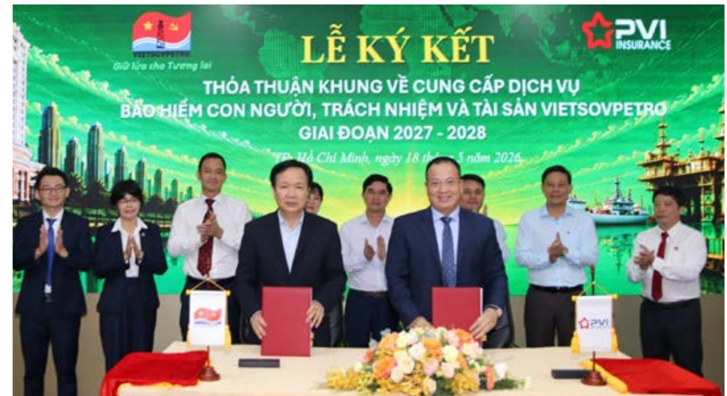
Ký kết Thỏa thuận khung về cung cấp dịch vụ “Bảo hiểm con người, trách nhiệm và tài sản của Vietsovpetro” giai đoạn 2027–2028

Theo nội dung Thỏa thuận khung, Bảo hiểm PVI sẽ tiếp tục cung cấp cho Vietsovpetro hệ thống chương trình bảo hiểm toàn diện đối với con người, tài sản và trách nhiệm, đáp ứng yêu cầu đặc thù trong hoạt động sản xuất – kinh doanh của một doanh nghiệp năng lượng quy mô lớn. Các chương trình bảo hiểm trọng yếu bao gồm bảo hiểm cháy và rủi ro đặc biệt, trách nhiệm công cộng, bảo hiểm người lao động trong nước và đi công tác nước ngoài, bảo hiểm hàng hóa vận chuyển và tàu, bảo hiểm trách nhiệm nghề nghiệp y tế, bảo hiểm máy