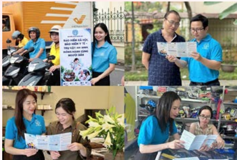
Tháng vận động triển khai BHXH toàn dân năm 2026: Tuyên truyền sâu rộng, phát triển mạnh người tham gia

Hưởng ứng Tháng vận động triển khai BHXH toàn dân năm 2026, BHXH Việt Nam đã đồng loạt tổ chức Tháng cao điểm tuyên truyền, phát triển người tham gia BHXH, BHYT trên phạm vi toàn quốc với chủ đề “Bảo hiểm xã hội - điểm tựa an sinh trọn đời”. Sau 1 tháng triển khai đồng bộ, trách nhiệm, linh hoạt từ Trung ương đến địa phương, nhiều kết quả tích cực đã được ghi nhận; góp phần lan tỏa sâu rộng ý nghĩa, giá trị nhân văn