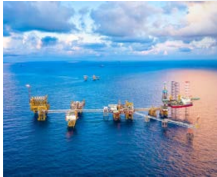
Trong 4 tháng đầu năm, chỉ tiêu sản lượng khai thác dầu thô của Petrovietnam tăng 14,3% so với cùng kỳ năm 2025.

Trong 4 tháng đầu năm, chỉ tiêu sản lượng khai thác dầu thô của Petrovietnam tăng 14,3% so với cùng kỳ năm 2025. Riêng quý I/2026, khai thác dầu thô toàn Petrovietnam đạt 2,63 triệu tấn, tăng 10,4%; khai thác dầu thô trong nước tăng 12%. Kết quả đó giúp quốc gia giảm phụ thuộc vào nguồn cung quốc tế, hạn chế tác động từ biến động giá dầu thế giới, cải thiện cán cân