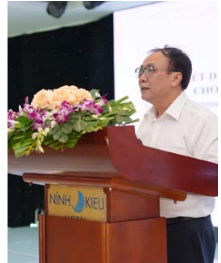
Ông Lê Đức Thịnh, Cục trưởng Cục Kinh tế hợp tác và Phát triển nông thôn phát biểu tại Hội thảo.

Về mảng tín dụng xanh, dự án hợp tác mô cùng Tổ chức năng tài chính vi TYM thiết kế gói vay hạn mức lên tới 100 triệu đồng mỗi hộ gia đình, áp dụng mức ưu đãi cho các mô hình sản phẩm sản xuất áp dụng phương pháp bền vững, gắn thiết bị như mặt trời và xử lý chất lượng cấp tốc. Đến nay, hơn 32 tỷ đồng đã được giải ngân đến 882 hộ gia đình. Trong phần này, công cụ xếp hạng tín dụng số hợp nhất trên ứng dụng di động của TYM đã được đưa vào sử dụng, xử lý trên 100.000 hồ sơ vay vốn và phát triển khai thực tế tại 13 tỉnh thành. Báo cáo của ban tổ chức cũng chỉ ra một đặc điểm trong kế hoạch của AgriCRF-VN là việc lồng ghép yếu tố vào các hoạt động thực địa, xuất phát từ vai trò của phụ nữ trong quản lý kinh tế hộ gia đình tại khu vực nông nghiệp. Theo đó, toàn bộ 882 hộ gia đình tiếp cận nguồn tín dụng xanh từ dự án đều đứng do phụ nữ tên đại diện. Bên cạnh đó, tỷ lệ nữ giới tham gia đội ngũ học viên nguồn đạt 66,7% và tỷ lệ lao động nữ được tiếp cận các