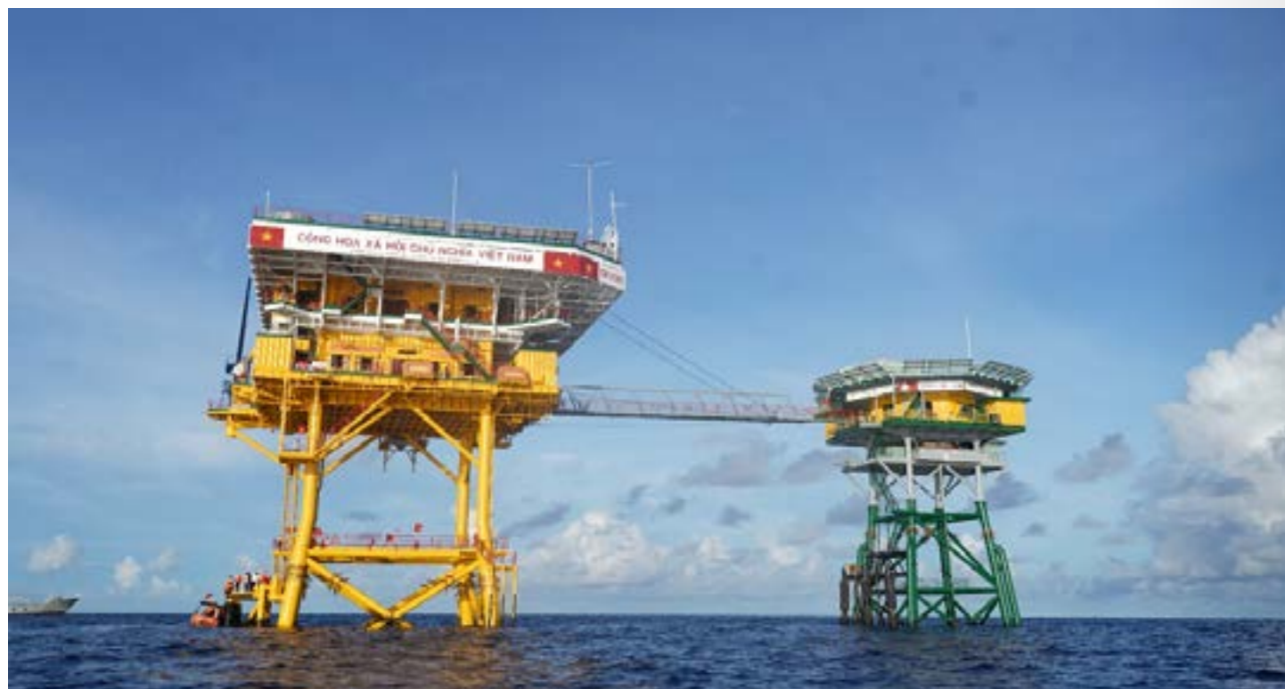
Đoàn công tác số 17 đã ghé thăm Nhà Giàn DK-1/20.