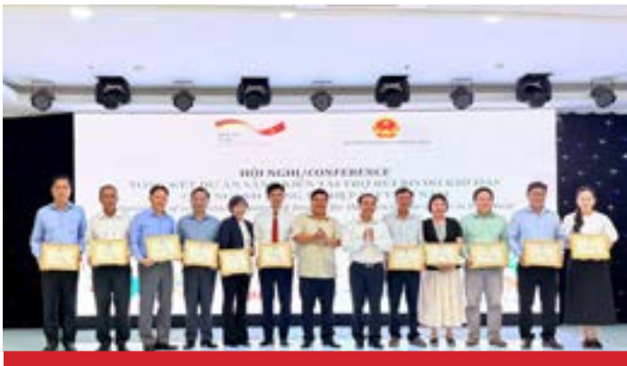
Dự án AgriCRF-VN: Hoàn thành các mục tiêu thí điểm về tài chính nguy hiểm cho khí hậu nông nghiệp