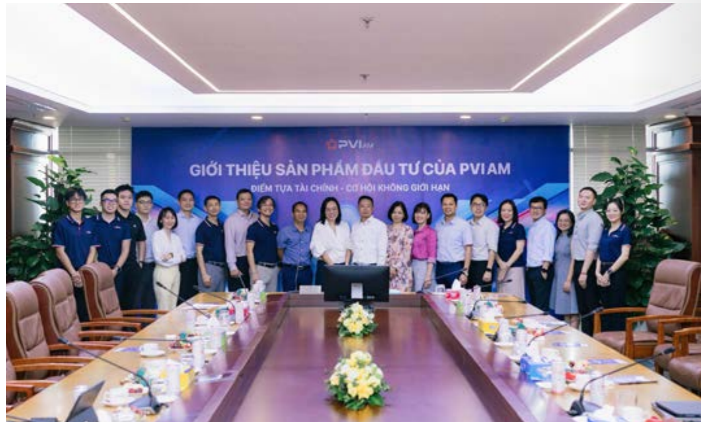
Ảnh lưu niệm tại Hội thảo đầu tư & Giới thiệu sản phẩm Quỹ mở IFNPVI.