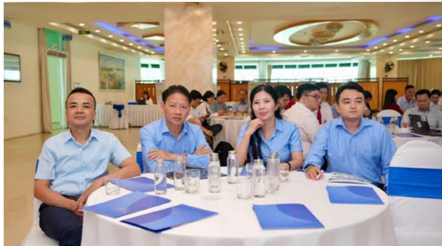
Dự án hỗ trợ của GIZ đã mang lại nhiều kết quả thiết kế tạo ra bước chuyển đổi về nhận thức về vai trò quản lý rủi ro trong sản xuất nông nghiệp.