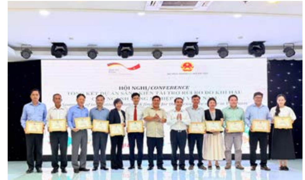
Bảo hiểm PVI nhận giấy khen thành tích xuất sắc trong triển khai hiệu quả Dự án Sáng kiến tài trợ rủi ro do khí hậu cho ngành nông nghiệp tại Việt Nam

vào các giải pháp hỗ trợ sau thiên tai, thì nay nhận thức được công thức đang tăng dần thay đổi theo hướng chủ động hơn: nông dân hiểu biết hơn vai trò của bảo hiểm nông nghiệp và tín dụng xanh; doanh nghiệp và các tổ chức tài chính có cơ sở mạnh mẽ hơn để thiết kế các sản phẩm phù hợp hơn; và cơ sở quản lý có thêm thông tin, bằng chứng thực tế để hỗ trợ xây dựng chính sách.