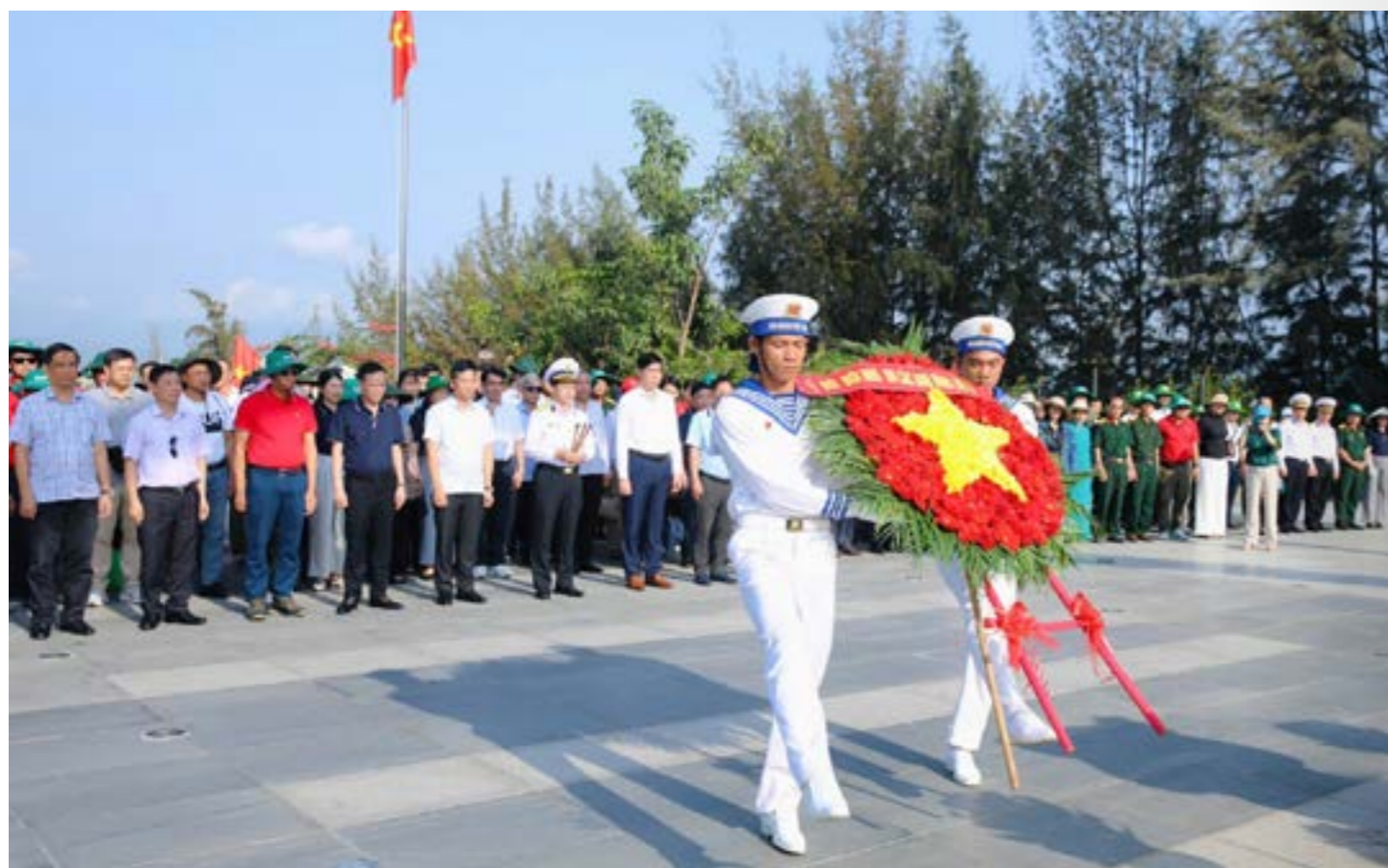
Đoàn Công tác số 17 thực hiện nghi thức dâng hương và dâng hoa tại Khu tưởng niệm chiến sĩ Gạc Ma.