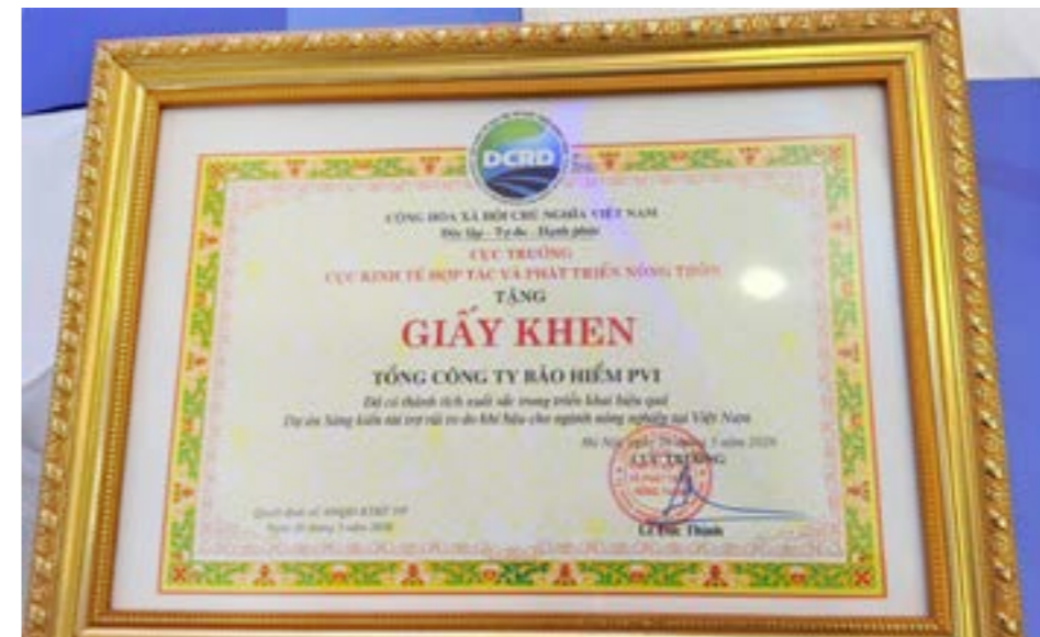
Bảo hiểm PVI nhận giấy khen thành tích xuất sắc trong triển khai hiệu quả Dự án Sáng kiến tài trợ rủi ro do khí hậu cho ngành nông nghiệp tại Việt Nam

Theo thông tin cập nhật từ tiến độ thực tế, sản phẩm tín dụng xanh do dự án xây dựng hợp nhất đã được tổ chức chức năng mở rộng ứng dụng chủ động này tại 9 tỉnh với 22 chi nhánh ngoài phạm vi cấm đầu dự án. Điều này cho thấy khả năng thích ứng và vận hành ổn định của mô hình theo cơ chế thị trường nhằm giảm thiểu thất bại do biến đổi khí hậu gây ra trong giai đoạn hiện nay.