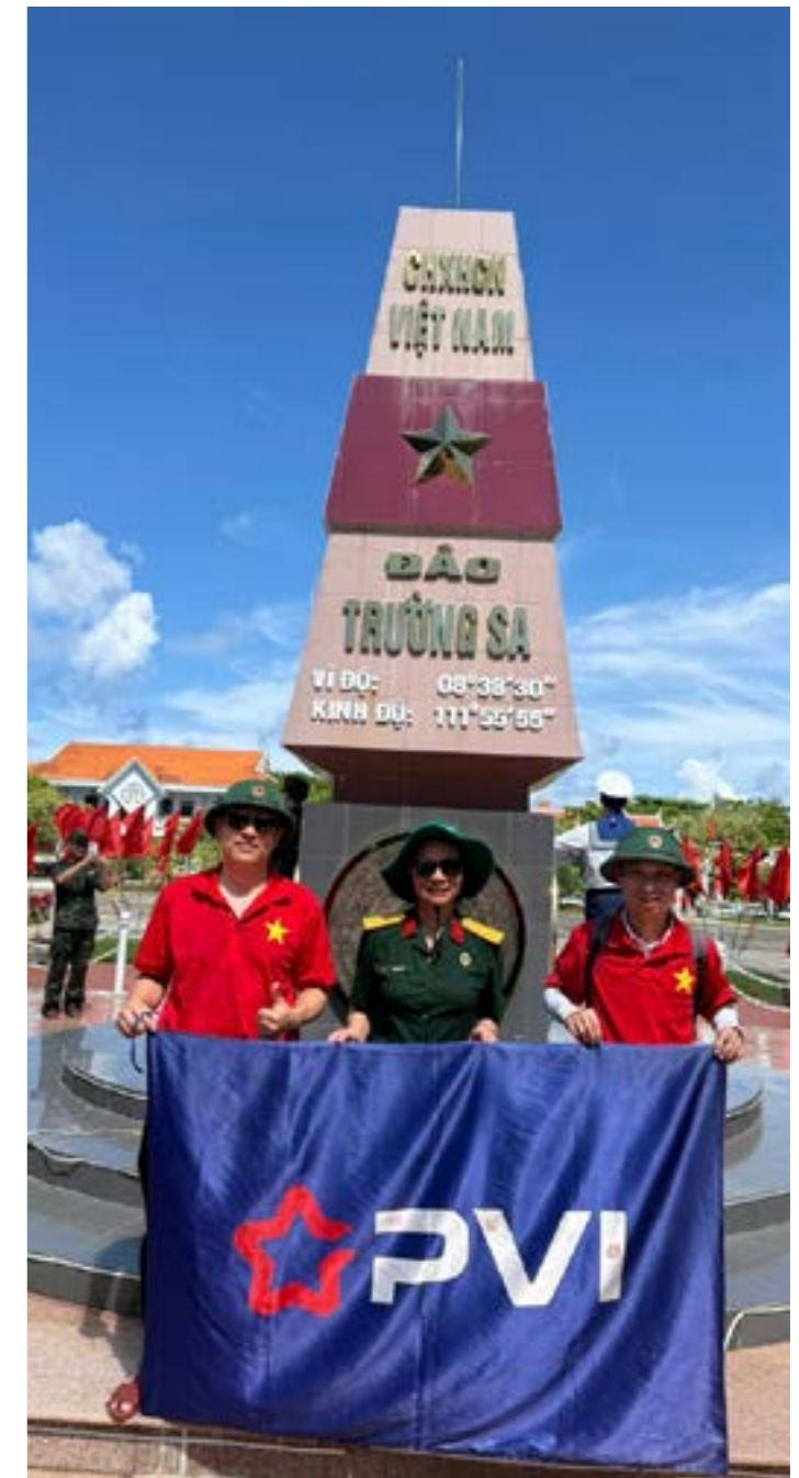
Đoàn công tác của PVI chụp ảnh lưu niệm tại Đảo Trường Sa

Chuyến đi khép lại, nhưng dư âm của biển đảo vẫn tiếp tục lan tỏa trong suy nghĩ và hành động của mỗi thành viên tham gia đoàn công tác.