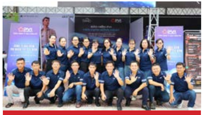
Bảo hiểm PVI mang trải nghiệm mới đến Lễ hội mô tô phân khối lớn Châu Á - Thái Bình Dương